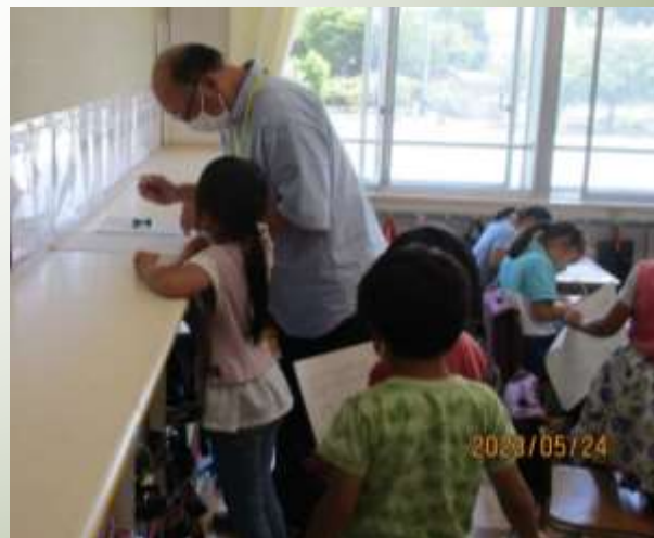
• 放課後学びタイム